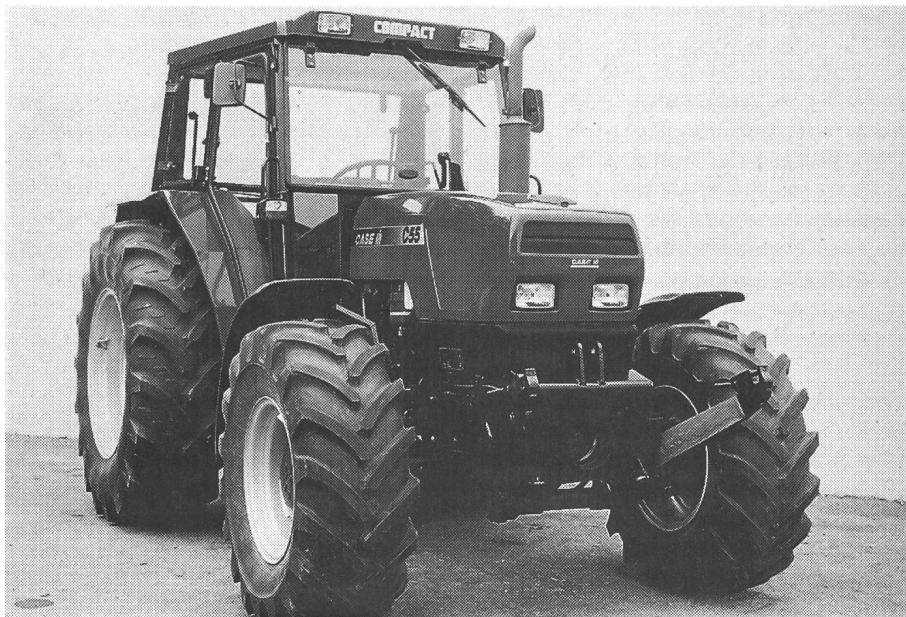
La série Compact comprend au total 5 tracteurs légers, très maniables et puissants.

Les propres ressources de Case pour le développement de produits destinés à des créneaux particuliers sont en principe existantes; cependant, des considérations économiques parlent contre une application de tels produits. Jeremy Lamb: «Vu les intérêts internationaux, nous avons trouvé la meilleure voie, c'est-à-dire la coopération avec un spécialiste réputé qui a fourni ses preuves pendant plusieurs générations: un Know-how mis au service du développement et de la production de tracteurs polyvalents de haute qualité.» La série Compact Case IH comprend au total 5 tracteurs légers, très maniables et puissants qui, de par leur apparence et leurs détails techniques, s'adaptent très bien au programme Case IH. Ces tracteurs de la gamme Compact seront vendus par un réseau dense de concessionnaires.