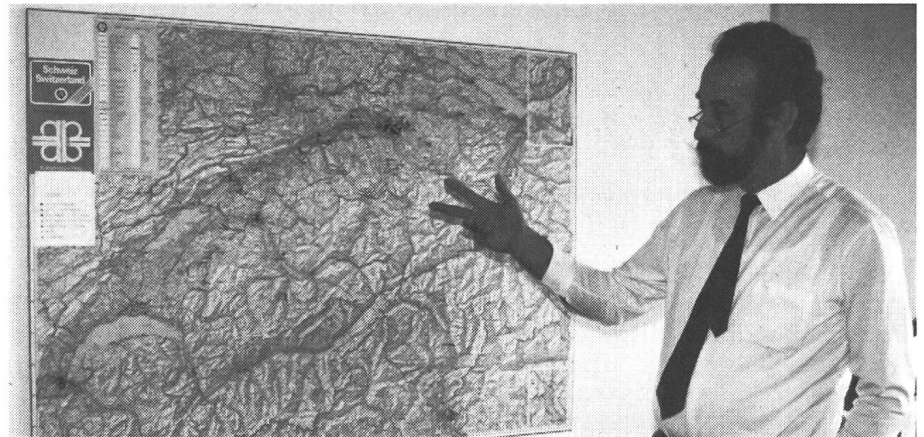
Les importateurs de véhicules automobiles en tous genres sont présents sur tout le plateau; ils se concentrent toutefois autour de Genève et Zurich.

Les importateurs de chariots de travail et de chariot à moteur seraient très touchés par ces mesures. La CE ne connaît cette catégorie de véhicules, mais examine la possibilité d'intégrer les chariots à moteur aux directives qui régissent les tracteurs.