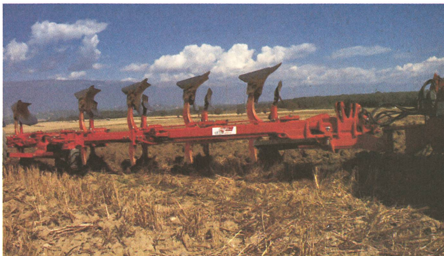
Gigantisme agricole avec ... 3, 4, 5 ou 7 socs!

Agri techno à Epalinges fait son entrée dans la branche avec des produits dérivés de l'agriculture. La firme importe les compteurs d'heures Mestrac, appareils indispensables à toute collectivité, louant des machines. Dickey-John, contrôleur de pulvérisation universel, autre produit représenté par Agritechno fournit les résultats de pulvérisation avec édition immédiate d'un ticket sur le champ, grâce à une machine imprimante. Sé