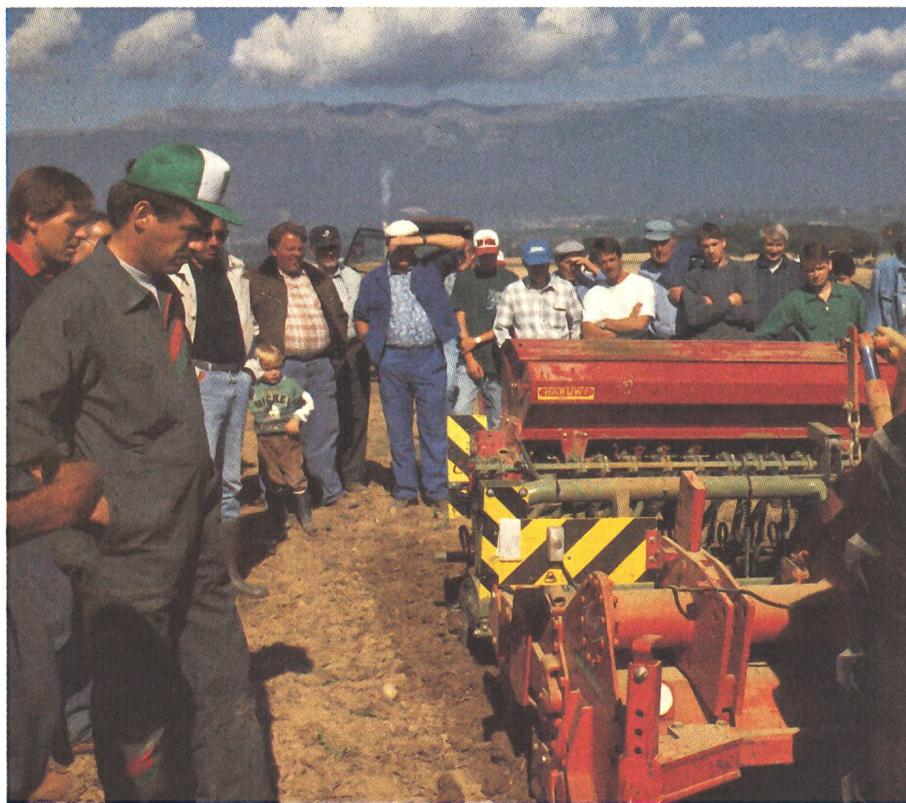
Chez Kuhn, préparation du sol avec rotovateur; semoir en bandes de Nodet.

Rabe Werk montre, attelés à l'avant et à l'arrière du porte-outils Xylon, une combinaison de chisel, herse rotative et semoir en ligne. Plus loin, les combinaisons Amazone et Huard toujours appréciées. Leur point commun: une combinaison pour toutes sortes de graines et de fertilisants distribués un seul passage. La machine permet de