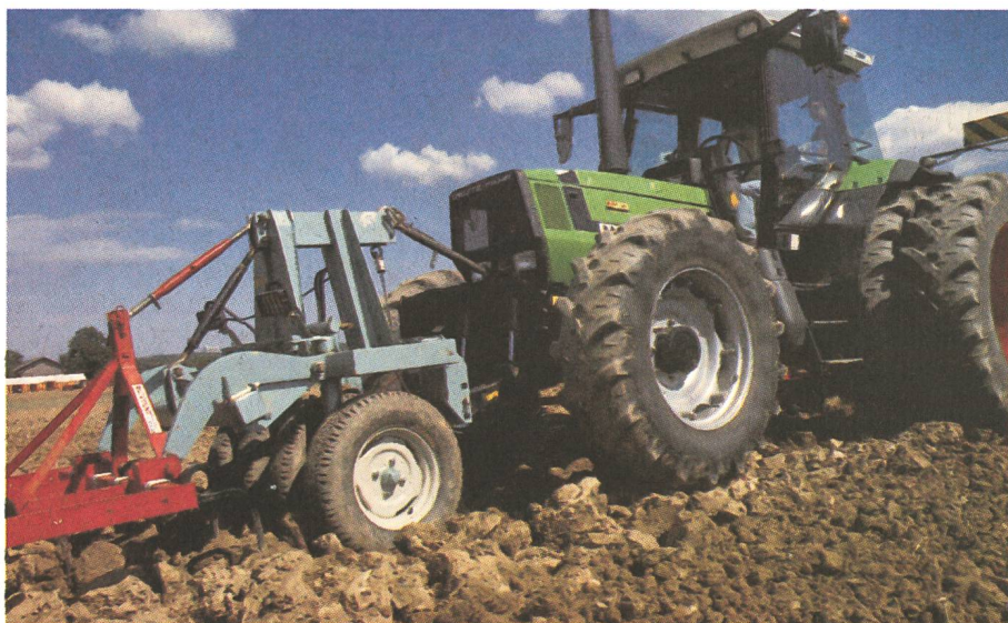
Trois atouts pour cette combinaison qui réunit le compactage préalable, le délestage de l'essieu avant et le rouleau dirigeable.