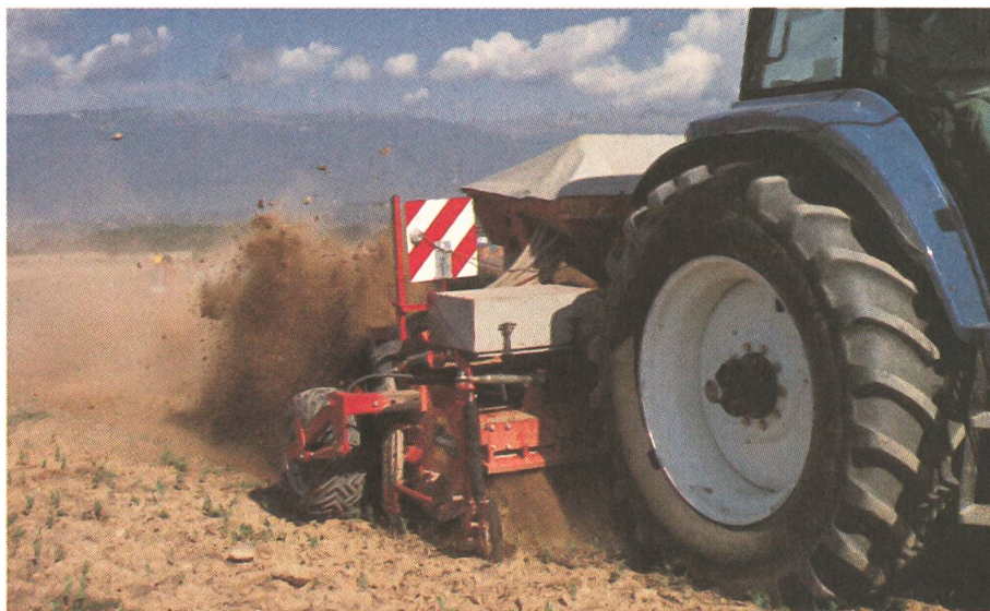
Une couche de terre fine protège la graine. Méthode Horsch.