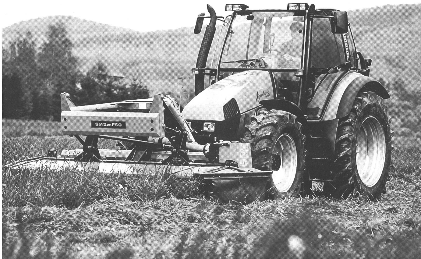
Excellente vue circulaire au volant de l'Agrotron.

La série Agrottron est conçue sous forme de modules comprenant une ca-