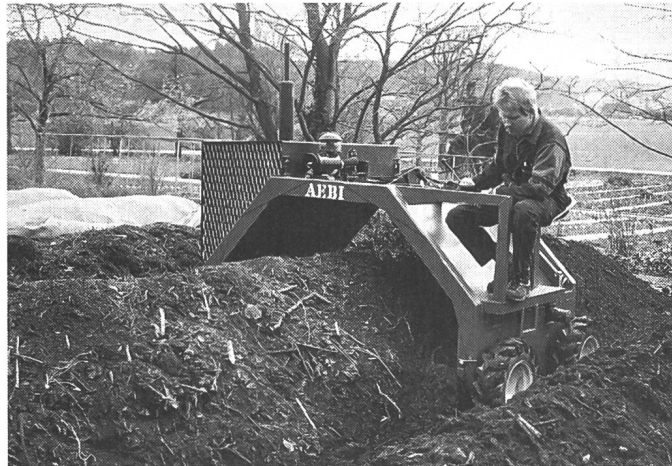
La toute nouvelle machine automotrice pour la reconstitution du compost Aebi KWM-250-SF est particulièrement indiquée pour le compostage économique et professionnel dans la commune.