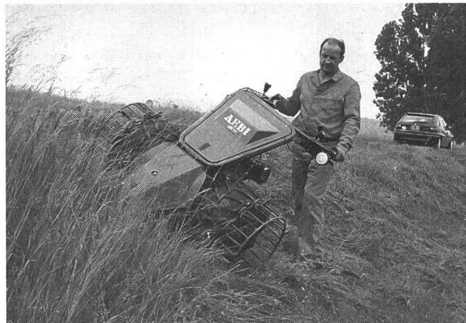
Les élégantes faucheuses pour pente raide AM18/AM20 d'Aebi Burgdorf, totalement remaniées, offrent à présent bien plus de confort et de sécurité.