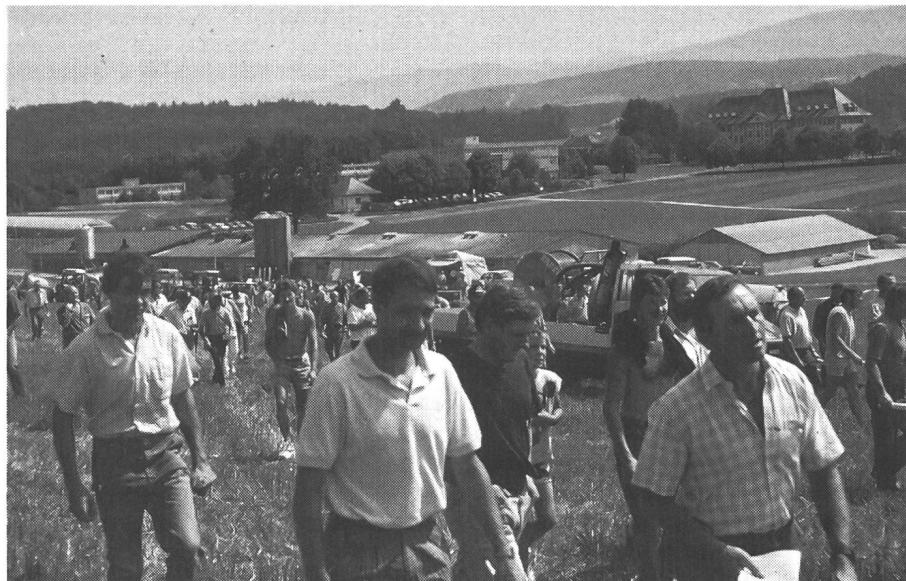
Les lieux des démonstrations 1995 sont pratiquement répartis dans toute la Suisse.

de végétation. Le tableau ci-dessous, préparé par la centrale LBL de Lindau, donne les indications sur le lieu, l'heure, les organisations responsables et le contenu de ces manifestations.