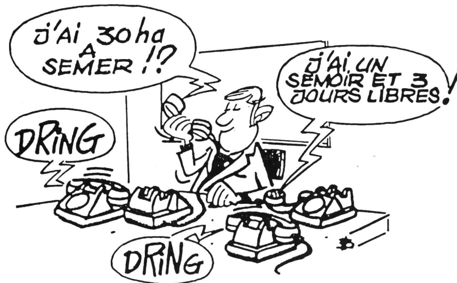
Rêve ou réalité d'un gérant de cercle d'échanges?

être saisis rapidement. Et comme le dit Urs Wernli: «Ainsi le gérant ne se perd pas en tracasseries administratives mais peut mettre son temps et ses idées au service des membres du CE.» Grâce aux annonces publicitaires, tous les agriculteurs habitant dans le rayon opérationnel du CE reçoivent la brochure gratuitement.