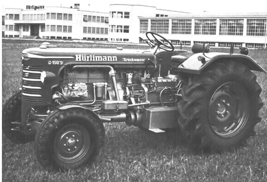
Le tracteur Hürlimann D-150, toujours apprécié avec transmission entièrement synchronisée, construit entre 1969 et 1973 dans les ateliers de Wil, SG.

Comme nous venons de le mentionner, le développement et la production sont entièrement en mains italiennes. Mais, à l'origine, la technique des moteurs de tracteurs vendus encore aujourd'hui se trouvait en Suisse. Les moteurs de la