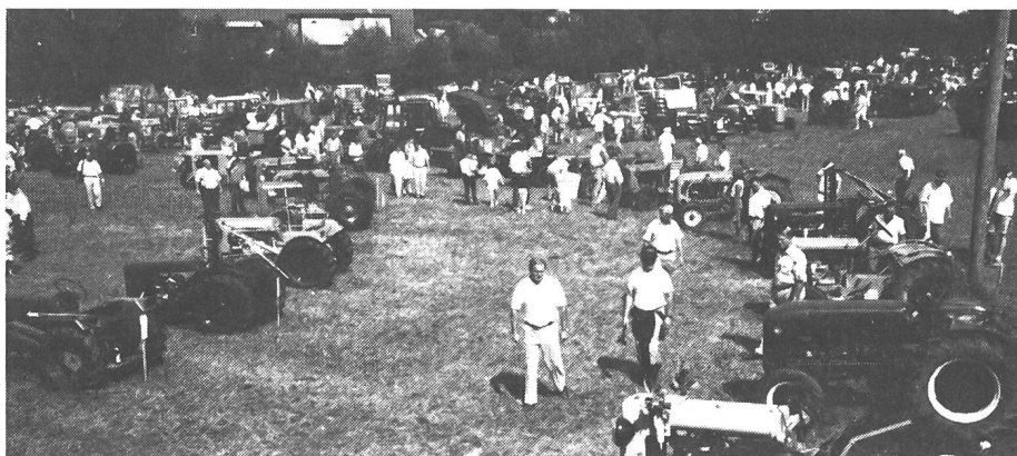
Exposition spéciale à Tänikon: coup d'œil sur les tracteurs fabriqués en Suisse.

Sur l'aire de la Station de recherche de Tänikon, on a vu tout ce que la Suisse comptait d'anciens tracteurs (ou presque!) au cours d'une manifestation qui a attiré plus de 16 000 visiteurs. L'attraction: l'exposition spéciale «Les tracteurs suisses». Les organisateurs ont voulu rappeler qu'au début de ce siècle plus de 80 maisons suisses fabriquaient des tracteurs agricoles. 68 de ces vétérans, représentant chacun l'une de leur firme, étaient au rendez-vous.