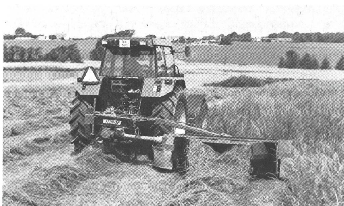
CM 2650 avec conditionneur.

– Un contrôle de débit (set pour le contrôle de débit gratuit) et la vidange de l'engrais restant est très facile à faire grâce à la fermeture rapide des disques! (sera une prescription future). – Les pièces en V2A (acier inoxydable) garantissent le bon fonctionnement et gardent la valeur sur plusieurs années. La projection précise est évidente pour le distributeur Rauch – avec un réglage simple et ex-