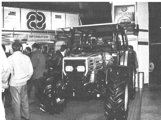
Pas de mise à la retraite pour cette fabrique suisse de tracteurs riche en tradition. La firme dont les tracteurs sont construits depuis de longues années en Italie fête son 65 e anniversaire: son cheval de bataille, une garantie de 3 ans.