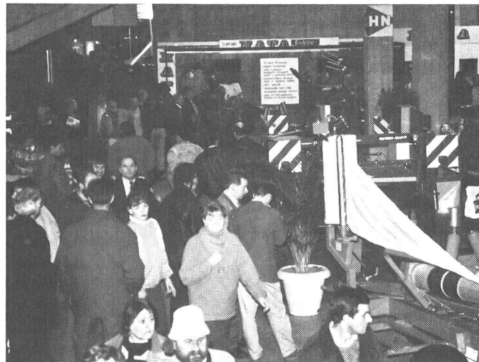
Un public averti et intéressé, des stands bien fréquentés: une image souvent rencontrée à l'Agrama.

Plus de 37 000 visiteurs, soit 15% de plus qu'il y a 2 ans ont pris le chemin de Saint-Gall afin de jeter un nouveau regard sur le marché suisse de la machine agricole. Cette augmentation confirme la direction prise par l'ASMA en matière de politique de foires: organiser une manifestation par an. Cependant, les exposants se demandent, en considération des tailles profondes infligées dans le budget publicitaire et du rapport coûts/profit, s'il vaut la peine d'investir dans une exposition où il est pratiquement impossible de présenter chaque année des nouveautés.