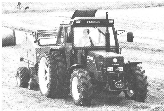
La nouvelle série 94 présentée à l'AGRAMA

Le Fiat «Winner» F 115 DT exposé à l'AGRAMA présentera de nombreuses améliorations apportées à la gamme supérieure des tracteurs Fiat.