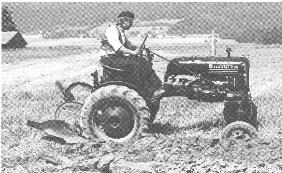
Un vieux «Mac» en pleine action; de toute beauté!