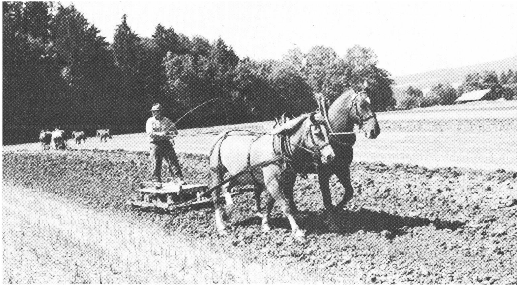
Les chevaux ont encore fort belle allure et ne manquent pas d'efficacité.

Champions suisses en titre par équipe, les Neuchâtelois se devaient d'organiser une épreuve de sélection performante en vue du championnat suisse de gymkhana de tracteurs du 5 septembre à Grangeneuve. La manifestation, patronnée par l'Association neuchâteloise des propriétaires de tracteurs et organisée de mains de maître par la Société des loisirs de Boudevilliers, a eu lieu le 1 er août dernier à Boudevilliers.