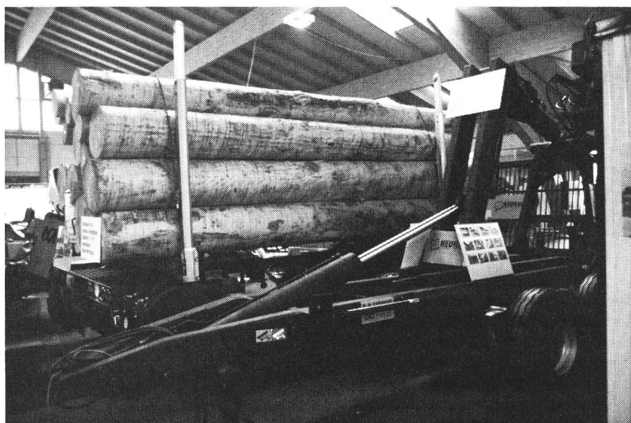
12 e Foire forestière de Lucerne du 26 au 30 août.

Ils seront presque 200 exposants à se partager plus de 26000 m 2 de l'Allmend à Lucerne (terrains en plein air compris) pour présenter leurs dernières nouveautés en matière de foresterie. Du génie forestier à la sylviculture en pas-