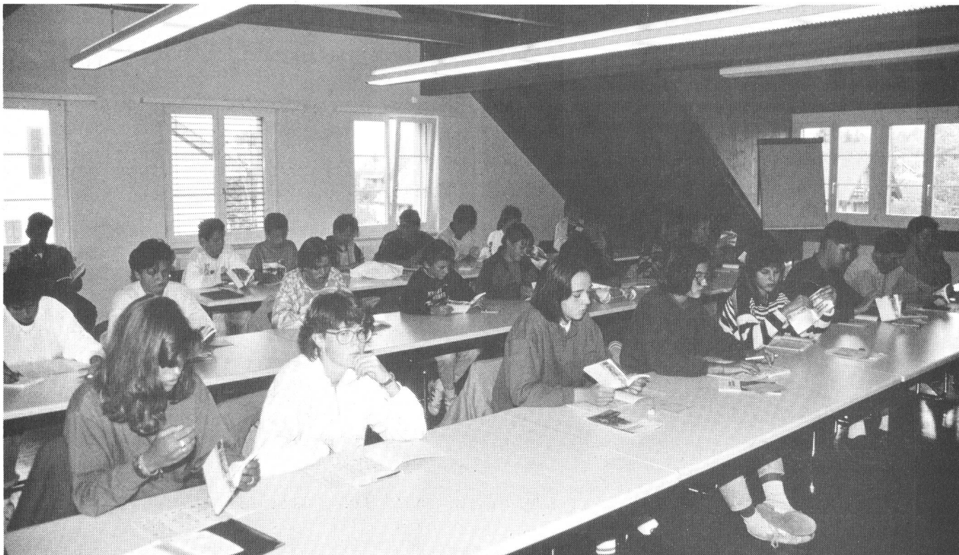
Tâche importante pour les sections de notre association: former des jeunes usagers, motorisés, conscients de leur responsabilité sur les routes.