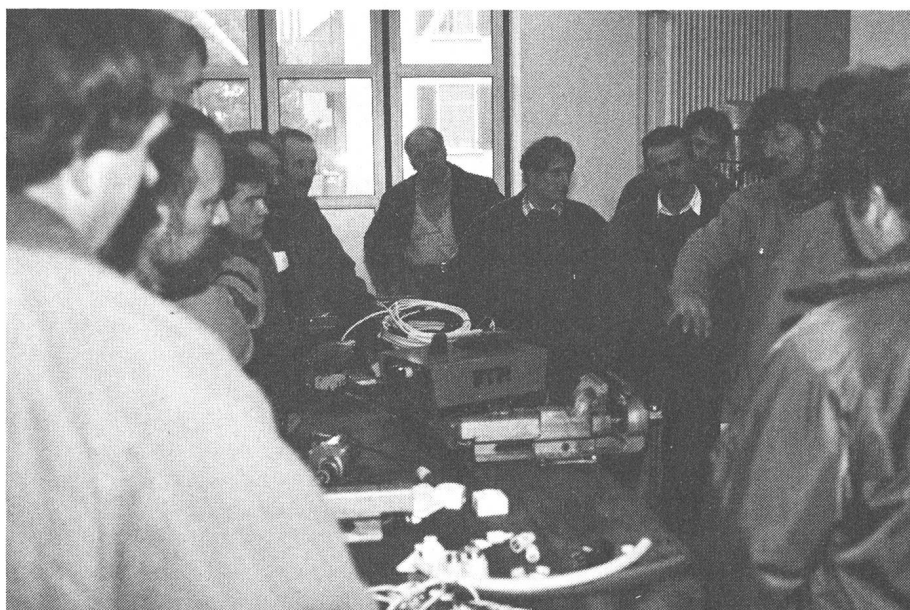
Installations électriques à la ferme et sur l'exploitation: un nouveau cours qui rencontre un excellent écho.

Pour la première fois à Riniken, les cours d'été ont vu le jour et ont suscité un intérêt certain: ils avaient pour objet les travaux d'entretien et de réparation. A Grange-Verney un cours destiné aux dames qui désiraient assurer leur sécurité dans le maniement du marteau, des tenailles, des perceuses a également rencontré un bon écho. Pour conclure, les cours informatiques (cours élémentaire) ont eux aussi remporté leur part de succès.