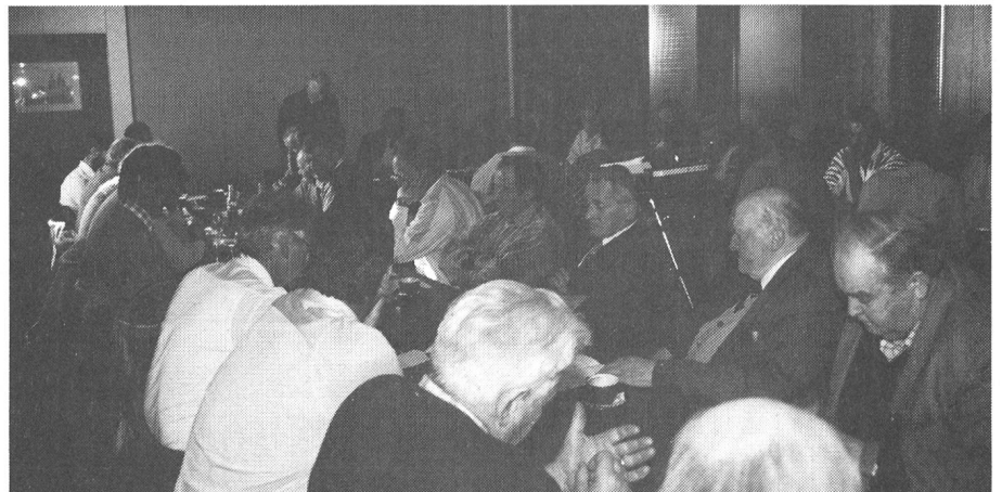
50 ans d'existence de l'ANETA. Un évènement que la Section Neuchâtel fêtera, entre autres, en invitant les membres de l'ASETA à l'assemblée des délégués.