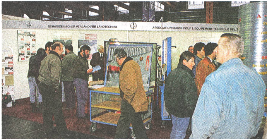
Pôle d'attraction à l'AGRAMA: le stand de l'ASETA, bien centré.