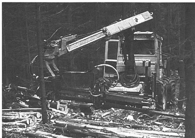
La technique conquiert la forêt comme la campagne. Les entreprises du bois peuvent exploiter le progrès, tout en appliquant de bas tarifs.

les entreprises forestières ne pourront plus financer les prestations qu'offre la forêt au grand public tels l'espace de détente ou la protection des villages de montagne.