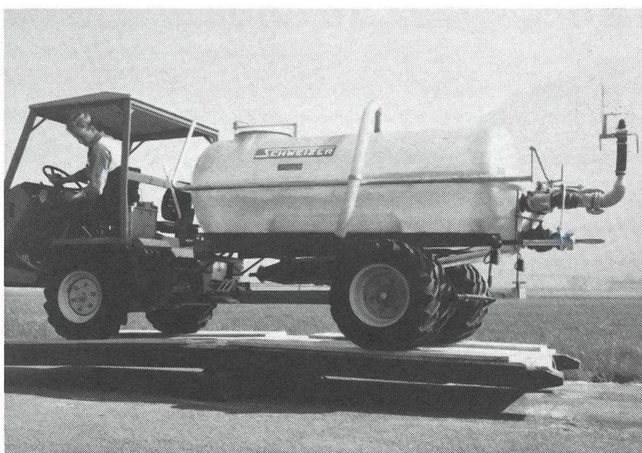
Organisé conjointement avec la Jeunesse rurale, les gymkhanas ont rencontré l'approbation des deux sections.

«Actuellement, l'agriculteur ne peut plus s'en sortir tout seul. Prévoir et prendre les mesures nécessaires sont devenus des impératifs de l'heure. Si nous laissons échapper quelque chose, les plaintes après coup ne nous seront pas d'un grand secours. L'association des paysans de Nidwald et un grand nombre de propriétaires de tracteurs sont d'avis qu'une section de l'association suisse des propriétaires de tracteurs devrait être créée dans notre région. Cette organisation compte maintenant plus de 25'000 propriétaires de tracteurs, répartis en 19 sections.» Propos marquants tenus par M.