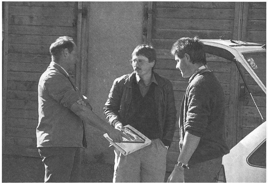
Le classeur contenant les fiches sur la «Prévention des accidents agricoles» permet d'évaluer les mesures de sécurité sur son exploitation. Les collaboratrices et collaborateurs du SPAA sont prêts en tout temps à vous donner des conseils utiles en matière de prévention.

Service des prévention des accidents (SPAA) Grange-Verney, 1510 Moudon Tél. 021 - 905 44 28