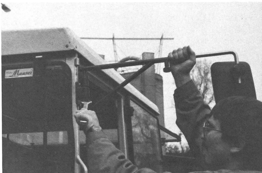
Risques d'accident réduits grâce aux rétroviseurs extensibles, aux panneaux de signalisation que l'on peut commander au SPAA

Le plus souvent ces mesures techniques sont des sièges anatomiques pour tracteurs ou le port de masque respiratoire