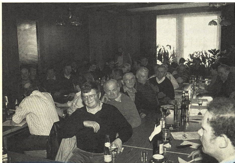
C'est en grand nombre que les membres ont assisté à l'assemblée annuelle de l'ANETA qui s'est achevée par les exposés de la Journée d'information.