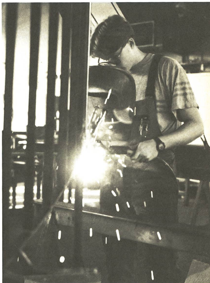
L'Union Suisse du Métal (SMU) regroupe 2500 firmes et plus de 25'000 chefs d'entreprise.

Le membre de l'USM s'engage, d'autre part, à encourager activement la formation et le perfectionnement de ses collaborateurs, aussi bien dans l'intérêt de sa