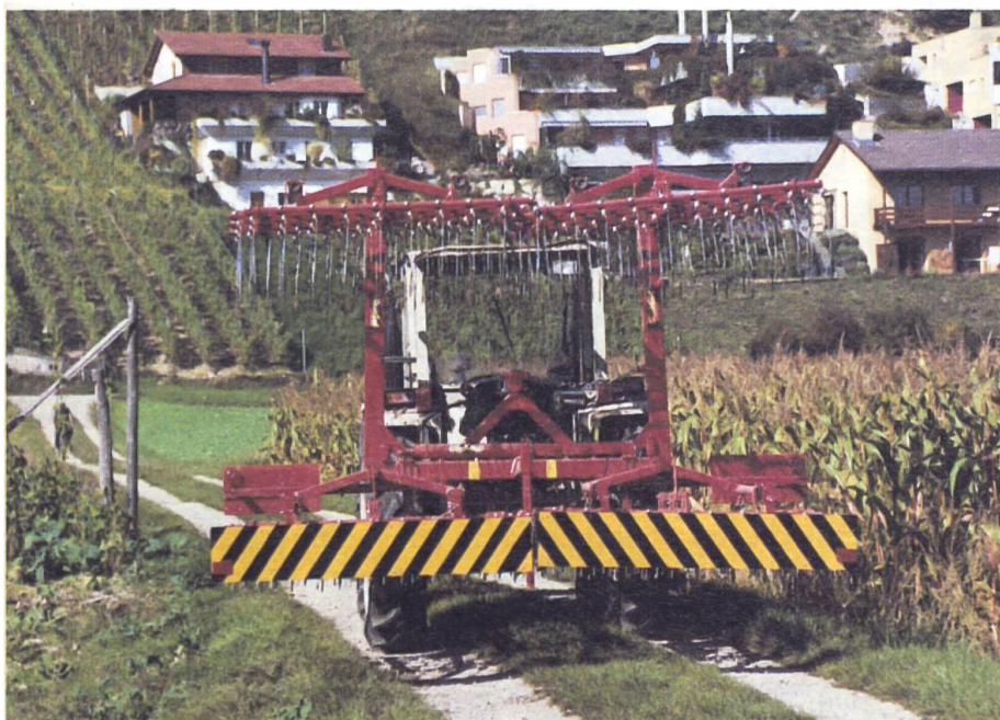
Ill. 3: Revêtir de protection adéquates griffes et arrêtes: ainsi de deux choses l'une: protection et largeur sont signalées en même temps.

de type, le service d'automobile n'a pas la possibilité de les examiner avant leur mise en fonction. Le devoir de signaler les outils n'apparaît qu'au moment de leur transport sur la voie publique. Malheureusement, certains négociants profitent de cette occasion pour vendre leurs outils sans les munir de l'équipement nécessaire. Interrogés sur cet état de fait, ils argumentent qu'un outil est tout d'abord prévu pour fonctionner dans les champs plutôt que sur les routes. Cependant, il va de soi que l'on peut obtenir l'équipement nécessaire moyennant des dépenses supplémentaires.