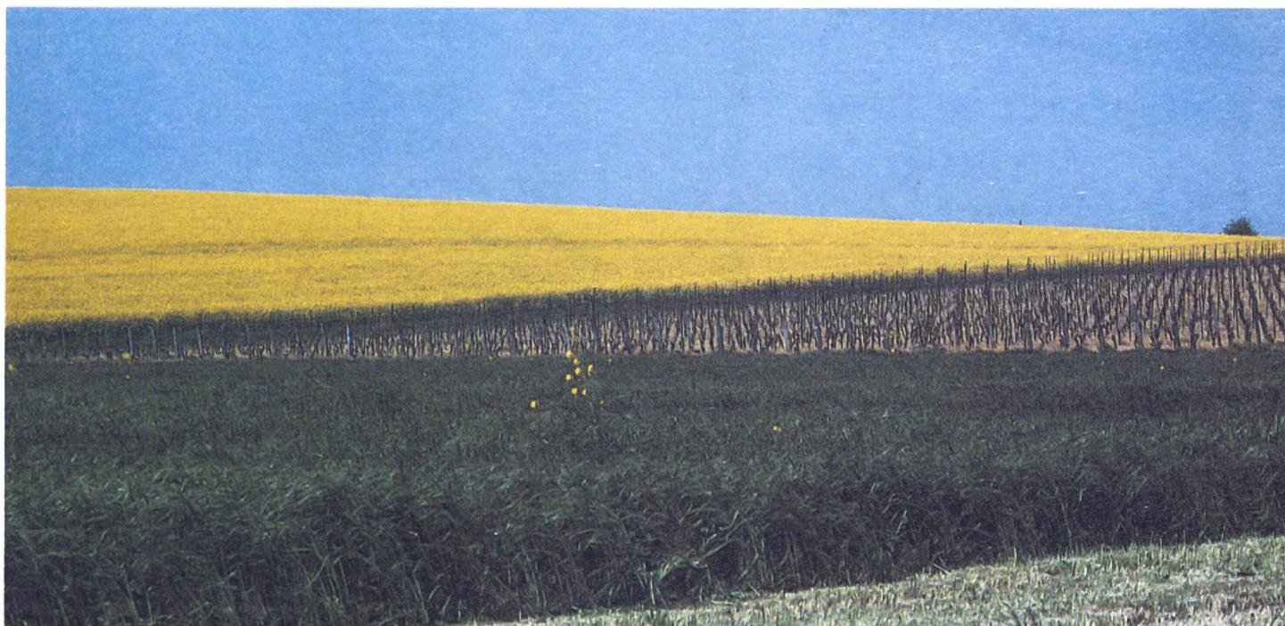
La «règle d'or» dans l'agriculture genevoise.