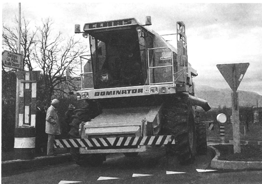
Légitime présence des véhicules agricoles genevois remise en question: La section Genève de l'ASETA s'oppose à certains assainissements routiers qui compliquent ou rendent même impossible le passage des moissonneuses-batteuses.

L'espace de manœuvre sur la voie publique est considérablement réduit – nous confie Pierre Forestier – car de plus en plus de voitures sont parkées le long des voies de circulation. Et ceci, depuis que la mode est aux dégagements devant les maisons,