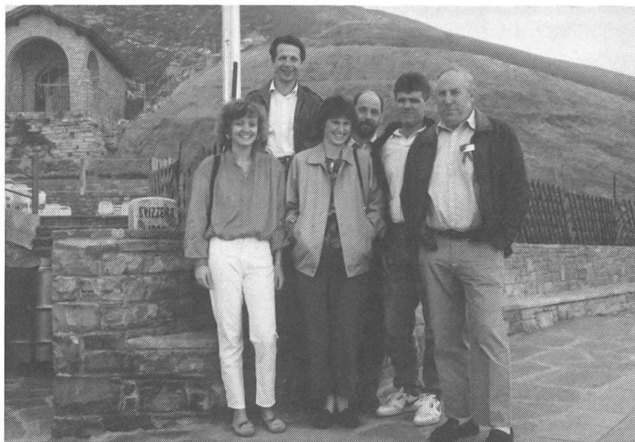
Le président de la section tessinoise et son équipe hôtes d'accueil de l'édition 1989 de l'AD.

des Délégués 1989, mentionnant encore une fois l'importance de l'initiative lancée par l'Union Suisse des paysans et invite les participants à se retrouver à Genève pour la 65 ème Assemblée des Délégués de 1990.