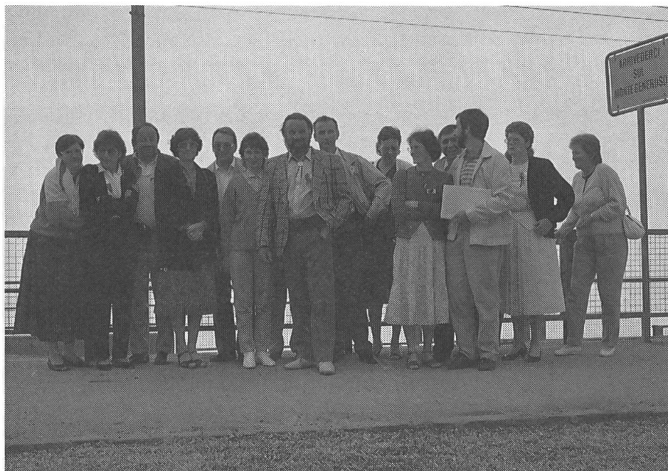
Une section bien représentée: la section fribourgeoise.