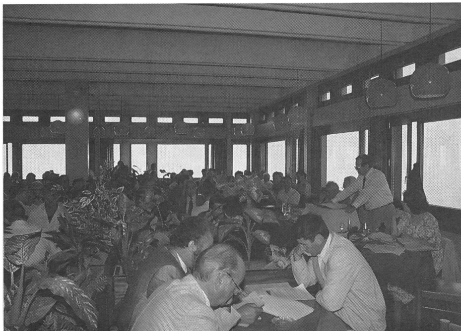
Assemblée annuelle des délégués sur le Monte-Genoroso: 160 participants!

L'Association Suisse pour l'équipement agricole compte actuellement 36'404 membres dont 6500 en Suisse Romande et 312 au Tessin. Même si l'on constate une diminution du nombre des exploitations agricoles, l'effectif des membres demeure constant. Lors de cette assemblée au Tessin, les délégués n'ont pas hésité de voter, à l'unanimité – malgré une situation saine des finances – une augmentation des cotisations pour 1990 en vue de la construction du nouveau centre ASETA à Riniken.