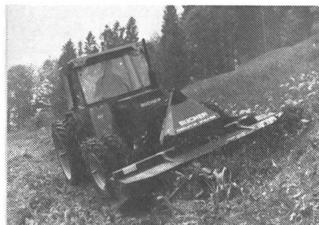
Les porte-outil Polytrac 50 munis de roues jumelées pour un travail efficace tout en ménageant le sol.

Le Bucher Polytrac 50 est un dérivé du tracteur Fiat 50-66 DT bien connu, qui est en plus le modèle le plus vendu de la gamme Fiat . Ce porte-outil universel, muni de relevages hydrauliques avant et arrière est très apprécié par la clientèle. Dans les régions de montagne il se prête à tous les travaux de la récolte du fourrage. Le centre de gravité bas et les roues jumelées contribuent à augmenter la sécurité. En plaine, il rend des précieux services aussi dans les cultures. Grâce aux nombreux accessoires il s'utilise pour des multiples travaux tout en ménageant le terrain.