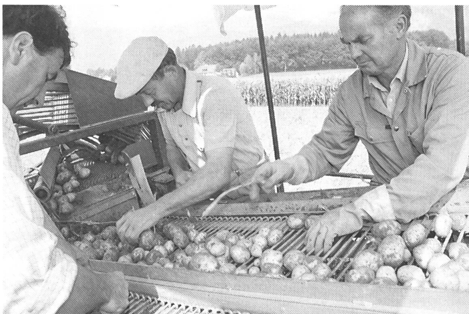
La récolte de la pomme de terre sur le domaine «Wallierhof», le centre de formation agricole, mais qui, pour quantité de Soleurois est plus éloigné que certaines écoles extérieures au canton.