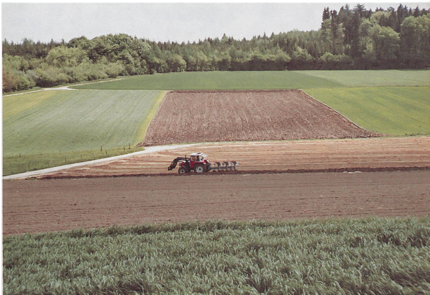
La technique agricole façonne le paysage.