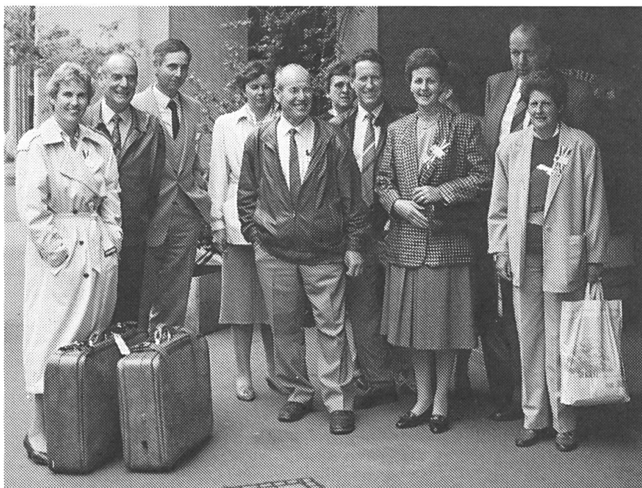
Quelques visages souriants rencontrés à l'AD à Bâle: Au moment du départ: rendez-vous photo d'une partie de la délégation romande.

Etant donné que le compte-rendu de l'assemblée des délégués tenue à Bâle a paru dans le dernier numéro et avant que la rédaction soit en possession des photos, nous aimerions faire suivre ici quelques images.