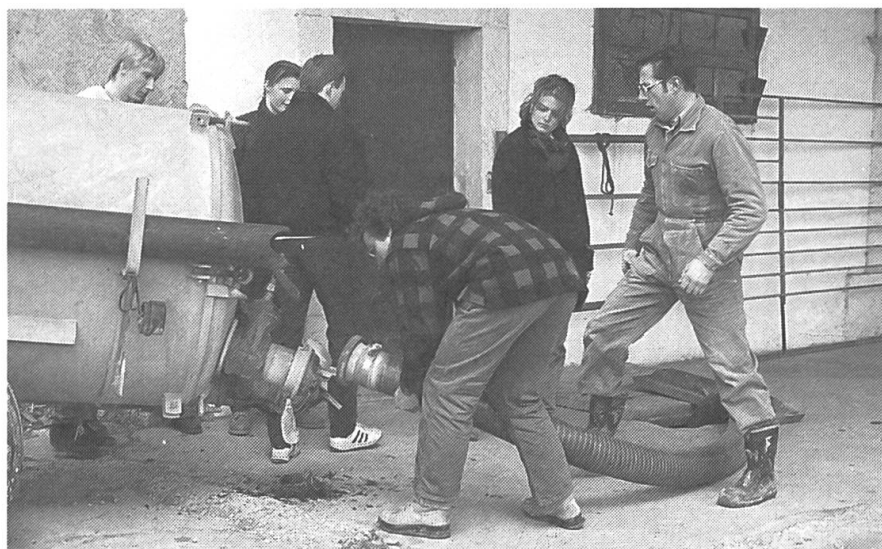
Les étudiants en agronomie du 4 e semestre à l'EPF Zurich font à présent leur stage pratique de six mois dans des exploitations à travers la Suisse. Des étudiants sans expérience pratique avec les tracteurs et les machines agricoles ont fréquenté un cours préparatif à l'école cantonale d'agriculture, Hohenrain LU ou au centre de cours ASETA à Riniken, où la photo a été prise.

Dans les localités: adaptez votre vitesse - Hors de celles-ci: gardez la distance!