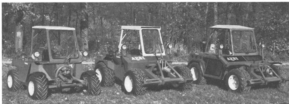
Série des Terratracs AEBI: TT33, TT77, TT88.

Les tracteurs MB-trac de Mercedes-Benz sont des tracteurs à traction intégrale sur les quatre roues, avec quatre roues de même dimension, deux essieux de même puissance et un verrouillage du différentiel sur les deux essieux. Un avantage complémentaire est donné par les trois zones de montage équivalentes pour les appareils d'appoint (avant, arrière et derrière la cabine), permettant de combiner différentes machines. Ceci permet d'accomplir plusieurs opérations en une seule passe. Le sol en est ménagé et on