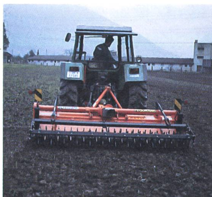
Préparer le lit de semences avec la herse à dents rotatives.