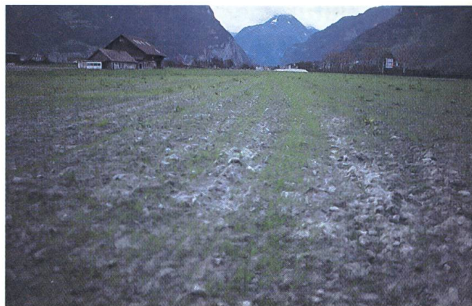
... La même surface semée le 9 octobre 1987 (vue prise depuis le nord).