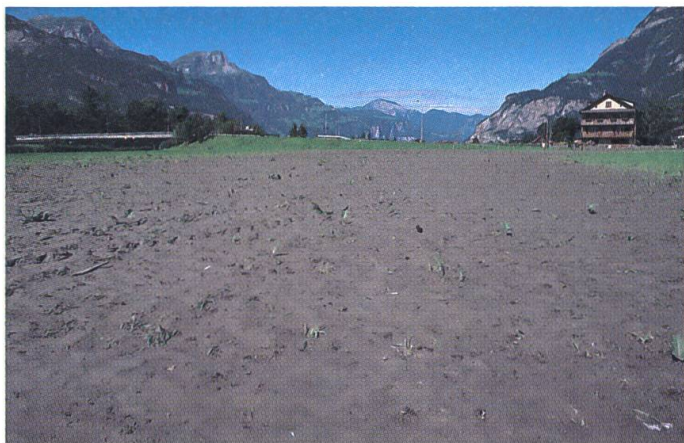
Image des dégâts du 7 sept. 1987: une couverture de glaise et de sable, épaisse de 15–20 cm couvre le sol de la plaine (vue prise depuis le sud)...