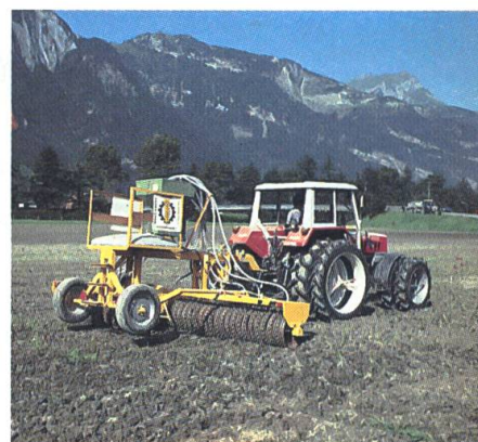
Ensemencer avec une machine spéciale pour l'herbe. On sème en général les mélanges standard 430 et 440.