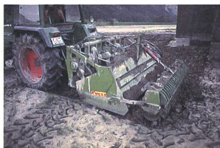
Avec la machine à bêches, la couche de matériel déposé est mélangée avec le sous-sol.

L'aide extérieure peut quelques-fois avoir un effet paralysant. Dans le Canton d'Uri elle est le simulacrum pour attaquer le travail immense qu'il y a encore à faire et qui, après-demain déjà, peut éventuellement être réduit à néant.