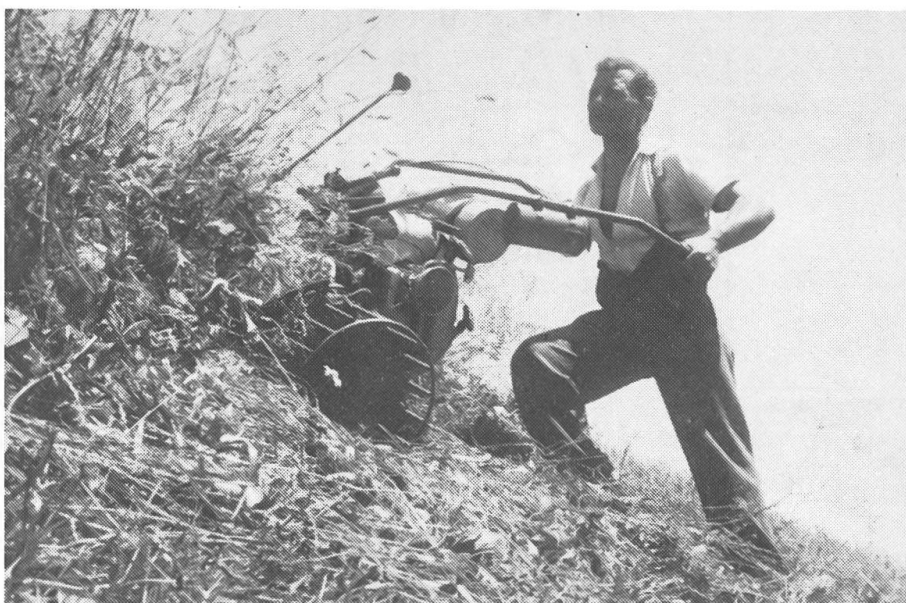
6: Les motofaucheuses de montagne légères et maniables ont permis le fauchage mécanique dans des pentes de plus de 80%.

amis des chevaux. Cela a eu pour conséquence en quelques années une diminution massive du cheptel de chevaux 2 ).