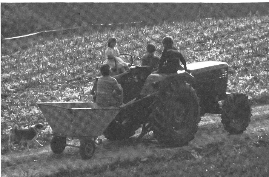
Façon très dangereuse de circuler en tracteur qui a souvent conduit à de graves accidents.

L'enfant est une personne à part entière avec ses particularités. La connaissance et le respect de celles-ci permettent de prendre les mesures de sécurité adéquates. L'enfant ne possède ni les capacités intellectuelles, ni les capacités physiques pour prévoir et éviter un danger. Ces capacités se développent peu à peu, ce qui atténue les risques au fil des années. Les enfants sont en outre très curieux et avides de connaissances. Ils pos-