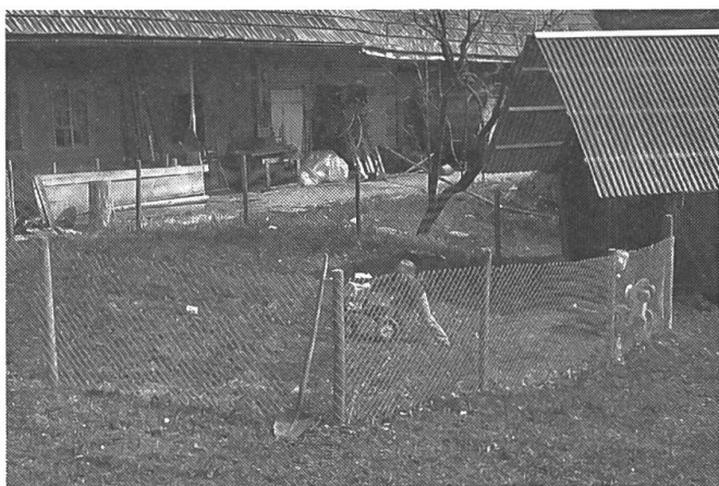
Les enfants peuvent jouer en toute sécurité à l'intérieur de ce parc clôturé car il sont maintenus hors des zones dangereuses.