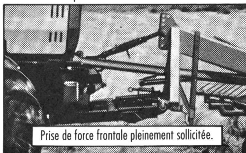
Prise de force frontale pleinement sollicitée.

Que vous fauchiez, épandiez ou que vous aériez le sol – avec le MB-trac vous êtes sûr de travailler efficacement. Avec ses deux prises de forces pleinement sollicitées de