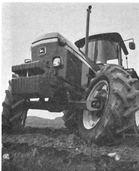
Fig. 1: Le programme de tracteurs «John Deere» comprend des types dans le domaine capacité entre 41 et 270 CV – DIN, type 3140, 100 CV (74 kW), toutes roues motrices, cabine de confort SG-2 et le nouvel essieu avant spectaculaire avec angle de braquage de 50°.

En tant que maison de commerce, MATRA représente en Suisse des fabricants étrangers de tracteurs et machines agricoles renommés. Au centre de l'offre se trouvent les tracteurs, moissonneuses-batteuses, ramasseuses-presses à haute densité et faucheuses-ensileuses de JOHN DEERE & Company, la plus grande fabrique du monde de machines agricoles, ainsi que les récolteuses de betteraves sucrières KLEINE, à Salzkotten. D'étroites relations d'affaires existent depuis plusieurs dizaines d'années déjà avec la plupart des fabricants. Un important stock de machines est constamment maintenu afin de