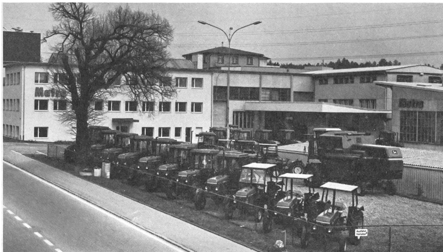
Vue depuis la rue principale