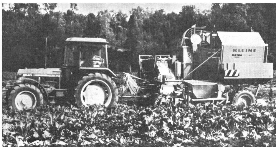
Fig. 2: Récolteuse totale de betteraves sucrières KLEINE Automatic 5500, le développement couronné de succès de la série «automatic».

Actuellement, MATRA emploie une soixantaine de collabora-