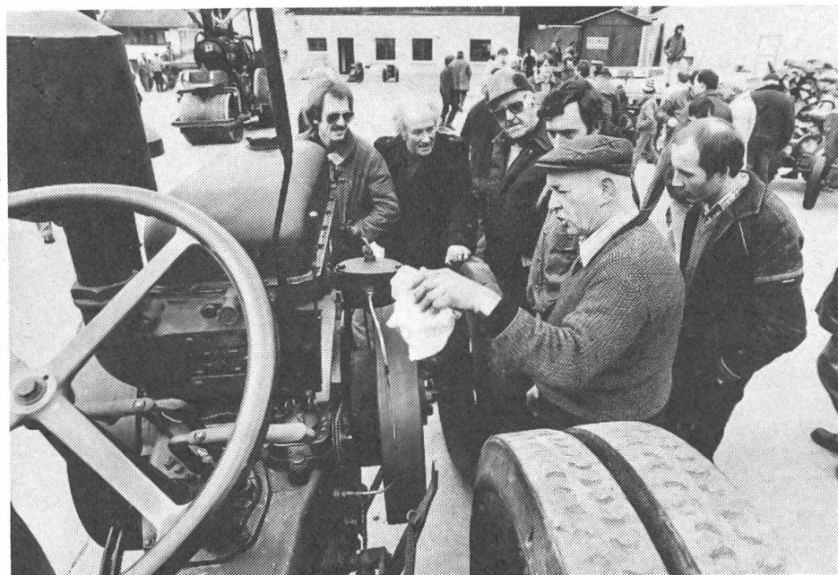
Fig. 3: A la fierté des propriétaires respectifs, les vétérans ont profité de l'occasion pour parler «métier» autour de ce Bulldog Lanz datant de 1926. La révision d'une de ces antiquités peut exiger environ 1000 heures de travail.