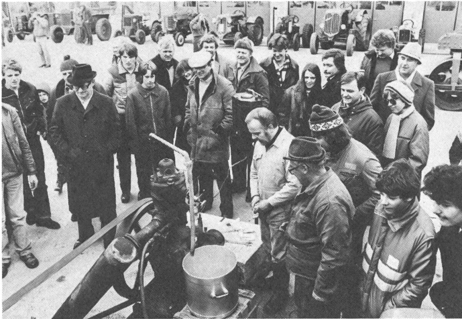
Fig. 2: Le moteur à culasse incandescente servait aussi à entraîner des machines stationnaires.