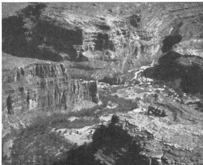
Fig. 4: Impressions fascinantes de Grand et Bryce Canyon.

Au départ du voyage, nous visitons Dallas et les agriculteurs spécialisés en élevage bovin, une station d'implantation d'embryons, ainsi qu'un ranch à 8000 unités de bétail Simmenthal. En Arizona, vous ferez du cheval à «Saguaro Lake Ranch» ou une excursion en bateau sur le Salt River. Suivra un voyage de quatre jours à travers le Grand Canyon, Bryce Canyon et le parc national Zion jusqu'à Las Vegas. Après un vol jusqu'à «Frisco» (San Francisco) et une visite de cette ville fascinante, vous échangerez des idées avec des Suisses établis aux E.U., dans leur club. Puis vous visiterez un abattoir et vous dégusterez du vin californien. Après un vol à St-Diego, vous visiterez l'entreprise Mc Douglas, constructeur d'avi-