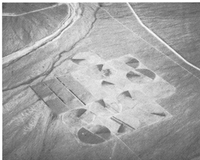
Fig. 5: Le désert est interrompu par des cultures irriguées artificiellement.