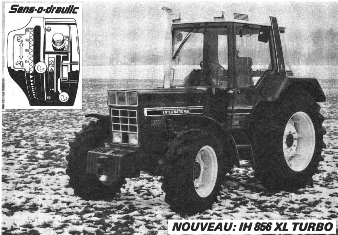
NOUVEAU: IH 856 XL TURBO