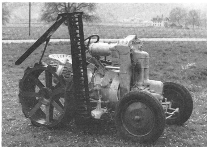
Fig. 1: Tracteur Hürlimann à barre de coupe incorporée (modèle 1930). Reconstitué dans l'atelier des apprentis de la firme de Hürlimann de Wil SG.