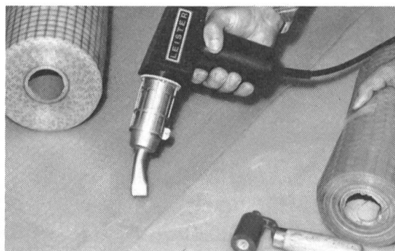
Le LEISTER pendant la soudure de feuilles PVC et Polyéthylène.

Demandez l'instruction de soudure gratuite GL 145 KARL LEISTER, 6056 Kägiswil, Tél. 041 - 66 54 64, Téléx: 78 305