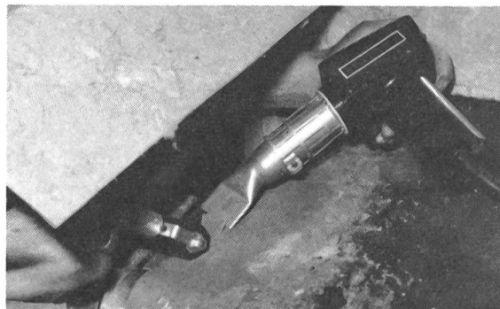
Le LEISTER pendant la soudure d'une bande roulante en PVC.