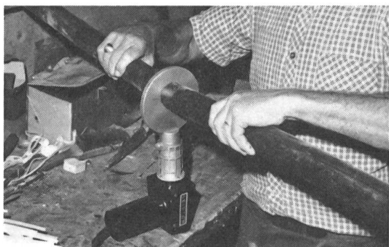
Le LEISTER pendant la soudure au miroir d'un tube en polyaéthylène.