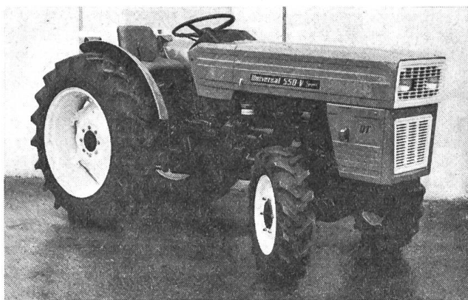
Le tracteur UNIVERSAL à 4 roues motrices et voie étroite V-550-DT (55 ch, rayon de braque de 3,25 m).

Une fois de plus, c'est un constructeur de tracteurs qui est parvenu à mettre au point un développement remarquable. Trad. H.O.