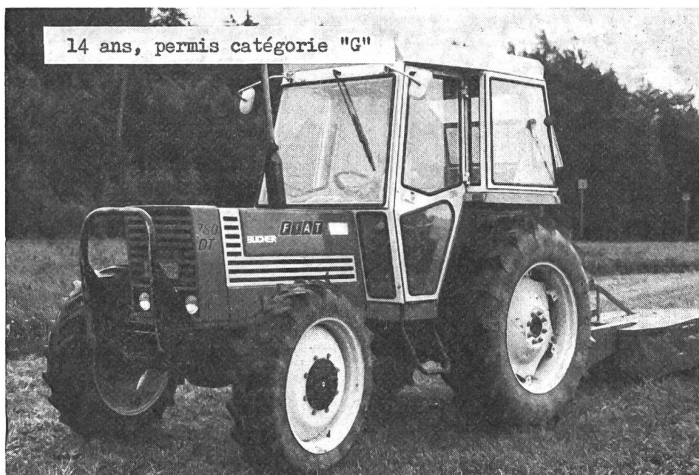
Fig. 1: Permis de conduire catégorie «G», âge requis 14 ans, donne le droit de piloter les véhicules automobiles pourvus d'une plaque verte, ainsi que les cyclomoteurs (examen théorique).

Raison pour laquelle nous nous permettons de vous remettre en mémoire quelques mesures essentielles à entreprendre en faveur de la sécurité ou de son amélioration.