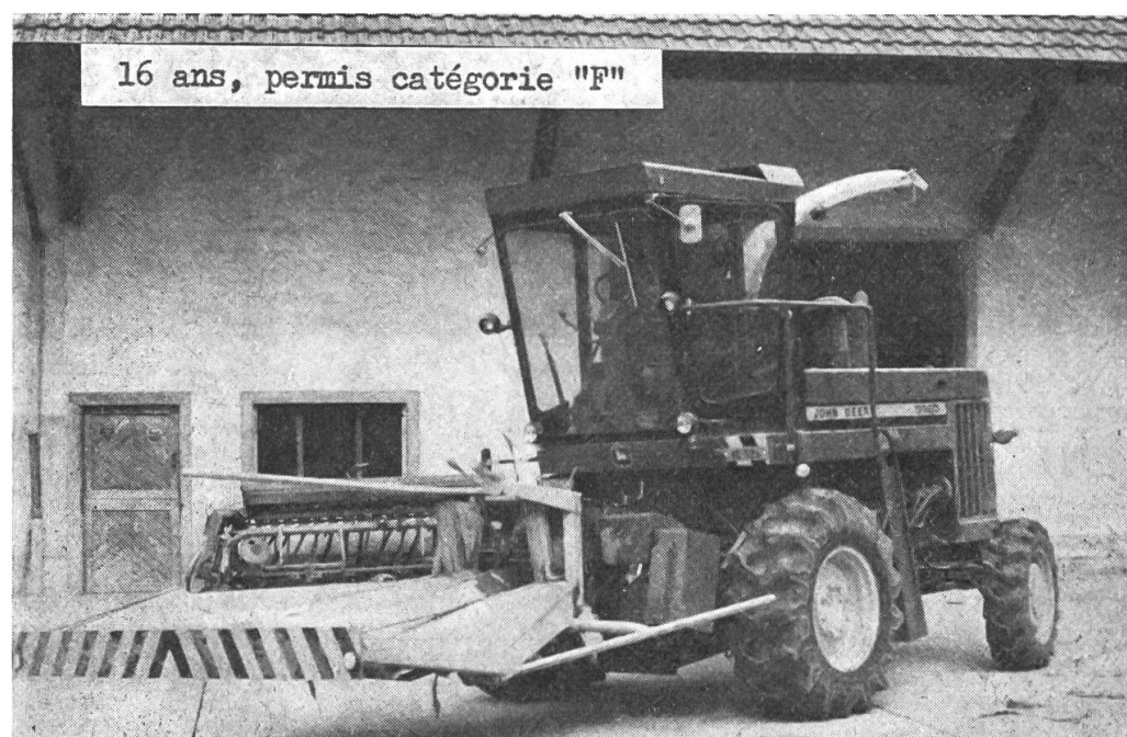
Fig. 2: Permis de conduire catégorie «F», âge requis 16 ans, permet la conduite de véhicules automobiles agricoles spéciaux. Ils sont pourvus de plaques brunes (examen théorique et pratique).