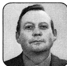
Edmond Panchaud Machines agricoles 1140 Echallens