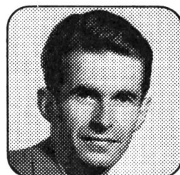
Isidore Gachet c/o Maison S.A.G. 1630 Bulle