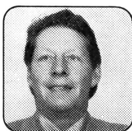
Jean Auberson Machines agricoles 1188 Gimel