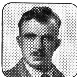
Bruno Zanier Machines agricoles 1411 Pomy