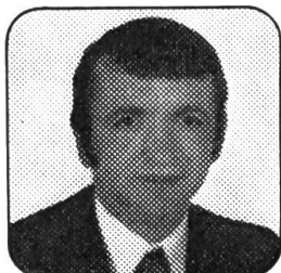
Victor Pitton Machines agricoles 1463 Chavannes-le-Chêne