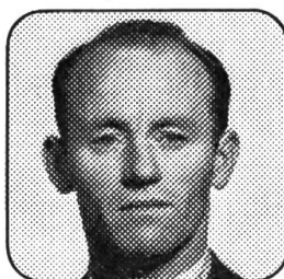
Josef Bosson Machines agricoles 1678 Siviriez