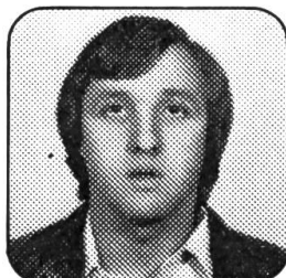
André Schleuniger Machines agricoles 1784 Courtepin