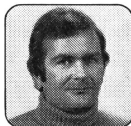
Jacques Aerni Machines agricoles 6516 Gerra-Piano