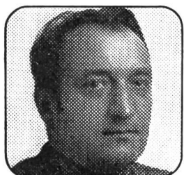
Josef Fleury Machines agricoles 2801 Courcelon