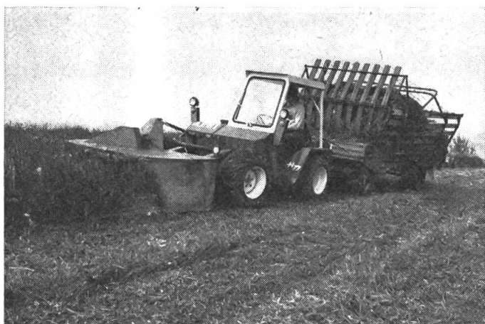
Fig. 5: Le Terratrak TT 77 AEBl exécutant la récolte quotidienne de l'herbe avec une faucheuse rotative PZ et une remorque autochargeuse Fella.

Les hacheuses-récolteuses à maïs MH 30 et MH 40 s'adaptent exactement au tracteur. Pour l'exploitation à un seul homme, il existe un support trois-points, laissant libre le crochet d'attelage du tracteur. Ainsi, il est aussi possible d'employer des remorques monoaxes sur des tracteurs relativement légers. Pour la chaîne de récolte parallèle, une rallonge de la conduite d'éjection est livrable. 2 modèles avec un débit de 30 et 40 t/h sont en vente. AEBl Burgdorf