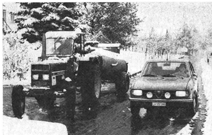
Fig. 3: Agriculteur montrant des égards pour autrui également dans la circulation routière en faisant signe de passer au conducteur d'une auto lucernoise.

pour ne pas retarder la marche des véhicules plus rapides. Il faut dire enfin que la campagne de propagande lancée par le gérant Hürlimann pour la prévention des accidents, qui s'est faite sans tambours ni trompettes, revêt de l'importance également pour les autres localités situées le long du parcours Bâle-Gotthard en ce qui concerne les conditions hivernales (neige, glace, brouillard).