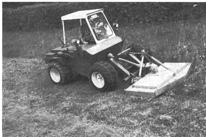
Fig. 2: Le Terratrak Aebi TT 77 muni d'une faucheuse réglable latéralement.