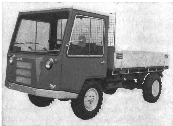
Fig. 3: Le Transporter Aebi TP 35 K destiné aux services communaux.

services publics et le service des jardins, il est devenu encore plus perfectionné et la série d'accessoires encore plus variée.