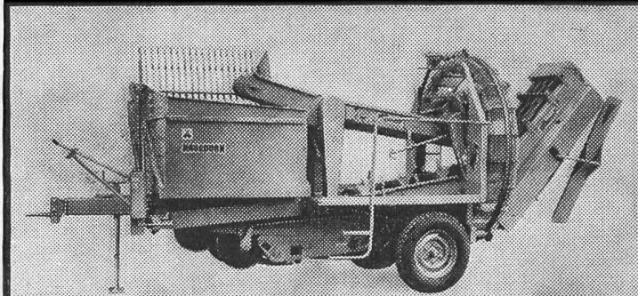
WISENT RB-70 combiné avec plateforme Approuvé par l'IMA

Les arracheuses - ramasseuses de pommes de terre «Wisent R» offrent tout ce qu'on peut demander d'une récolteuse moderne.