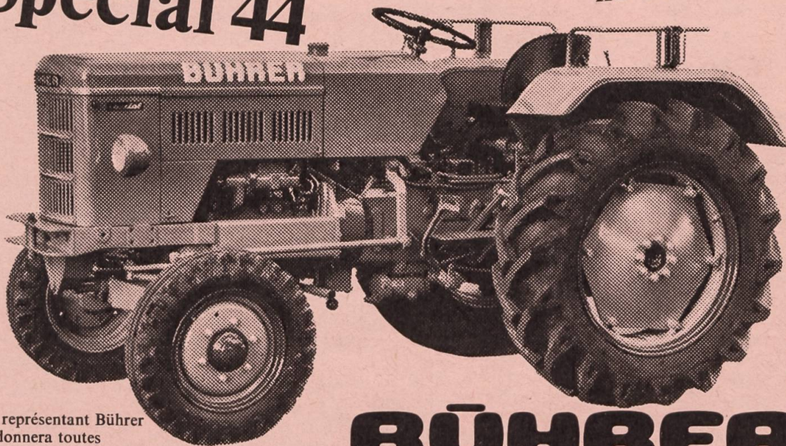
Traktorenfabrik AG, 8340 Hinwil ZH