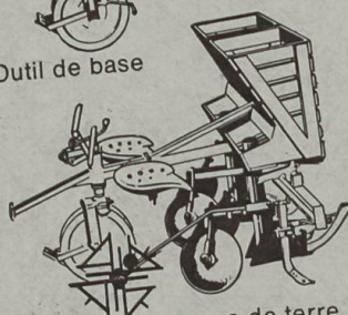
Planteuse à pomme de terre