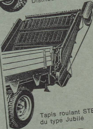
Tapis roulant STEIB du type Jubilé